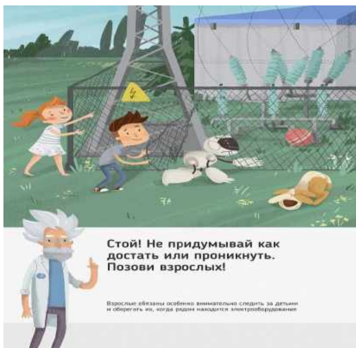
Рис. 5 Стой! Не придумывай как достать или проникнуть. Позови взрослых!