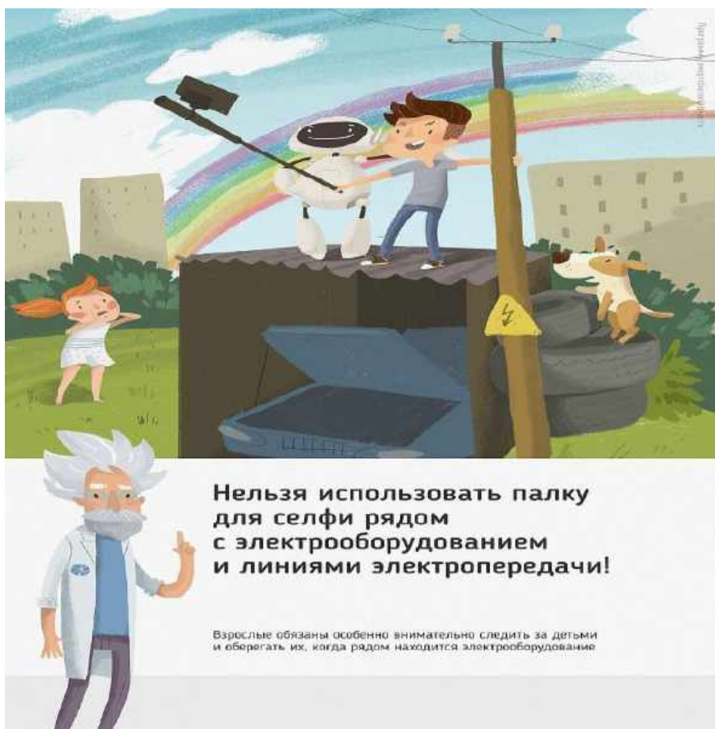
Рис2. Нельзя использовать палку для селфи рядом с электрооборудованием и линиями электропередачи

Ну и, наконец, нужно повторить с ребенком алгоритм действий в экстремальной ситуации. Проверьте, умеет ли он набирать на сотовом телефоне телефон экстренных служб. Изучите с ним вещества и предметы, которые хорошо проводят электрический ток и потому особенно опасны, и, наоборот, вещества и предметы, плохо проводящие электрический ток и полезные в экстремальной ситуации.