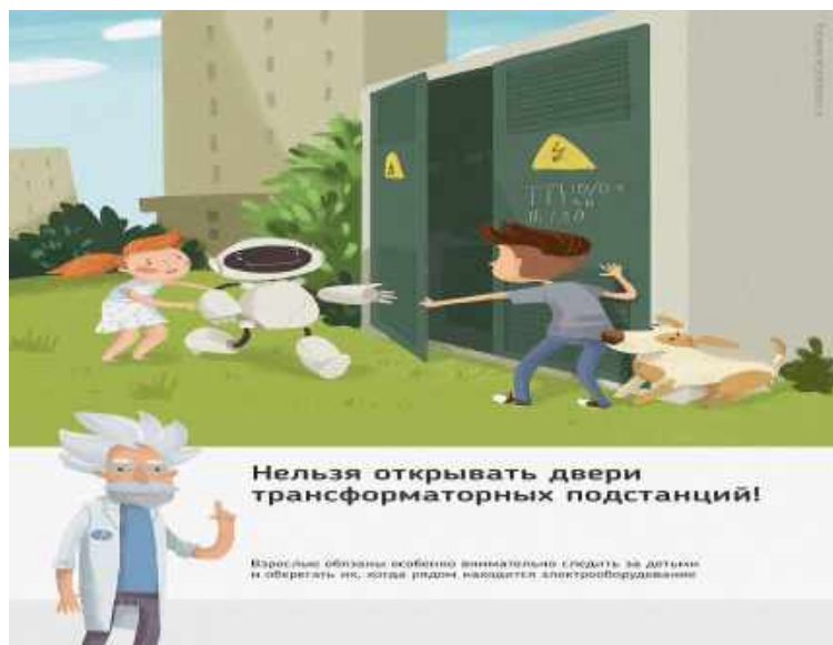
Рис.1 Нельзя открывать двери трансформаторных подстанций

Ежегодно энергетики проводят для школьников познавательные уроки, конкурсы рисунков и историй на тему электричества и правильного с ним обращения. Но работы одних энергетиков в данном направлении недостаточно, для полного понимания проблем электробезопасности нужен пример общества, в котором растет ребенок, и, конечно же, главным образом родителей. Эта работа приносит свои результаты: электротравмы на энергетических объектах единичные, и каждый случай становится поводом для служебной проверки. Но только технических мер мало для того, чтобы полностью обезопасить детей. Им нужен пример родителей.